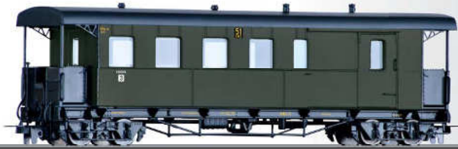
Packwagen CPw4i der NWE (Nordhausen-Wernigeroder Eisenbahn-Gesellschaft) Baggage car CPw4i of the NWE (Nordhausen-Wernigeroder Eisenbahn-Gesellschaft)