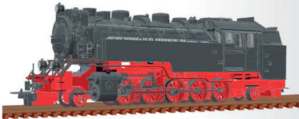
FORMNEUHEIT: Dampflokomotive BR 99.23-24 der DR NEW: Steam locomotive BR 99 23-24 of the DR