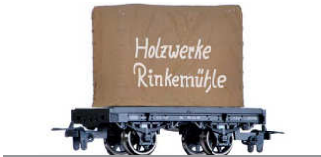
Drehschemelwagen der DR, mit Ladung unter Plane der Holzwerke Rinkemühle Cradle car of the DR, with load